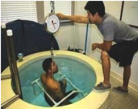
la pesée hydrostatique الوزن الهيدروستاتيكي