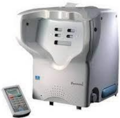
جهاز ergovision لقياس مستوى النظر