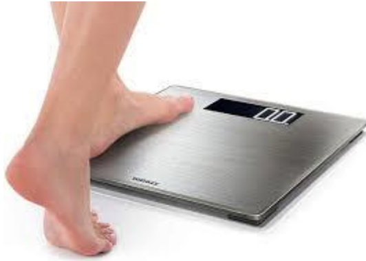
.ميزان الكتروني لقياس وزن الجسم