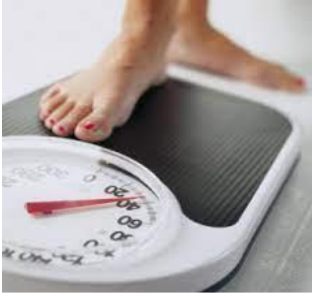
.ميزان عادي لقياس وزن الجسم