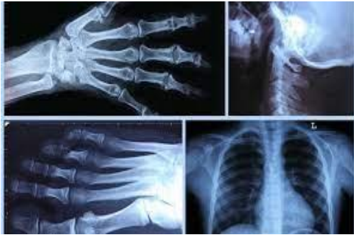
Examens radiologiques اختبارات الاشعة