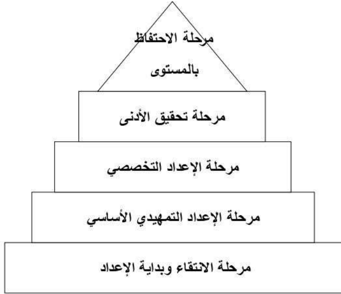
شكل رقم 2: مراحل التنمية الرياضية طويلة المدى (J.Coja et M. Mouraret,1986)