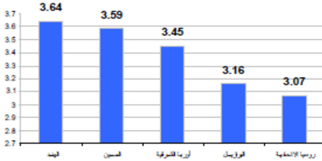
شكل (٢) : جاذبية الأسواق الناشئة للاندماج والاستحواذ