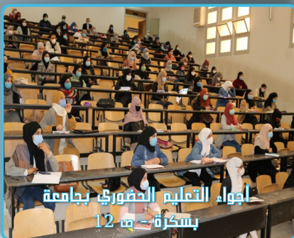
أجواء التعليم الحضوري بجامعة بسكرة - ص 12