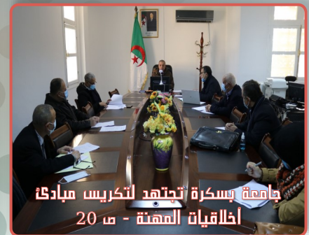
جامعة بسكرة تتجه لتكريس مبادئ أخلاقيات المهنة - ص 20