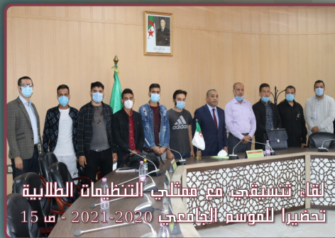
لقاء مسبق مع ممثلي التنظيمات الطلابية تحضيرا للموسم الجامعي 2020-2021 - ص 15