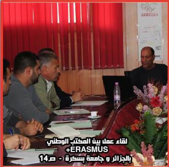
لقاء عمل بين المكتب الوطني ERASMUS بالجزائر وجامعة بسكرة - ص 14