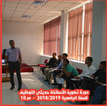
دورة تكوينية الأساتذة حديثي التوظيف للسنة الجامعية 2018/2019 - ص 10