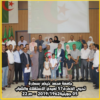
جامعة محمد خيضر بسكرة تحية الطربى 57 لعيد الاستقلال والشباب 05 جويلية 2019/1962 - ص 22