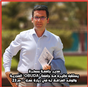
مدير جامعة بسكرة يستقبل نظيره من جامعة "OBUDA" المجرية والوفد المرافق له في زيارة عمل - ص 23